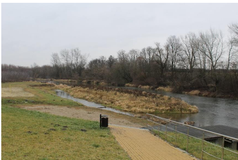
Rys. 3.6. Przystań kajakowa w Nowym Korczynie

Na odcinku rzeki w Nowym Korczynie należy uważać na wystające z wody pale. Kilkaset metrów za mostem – przystań kajakowa w Nowym Korczynie z wybudowanym pomostem, altaną, placem zabaw i polem biwakowym (Rys.3.6.) W pobliżu ruiny starej synagogi. Proponowane miejsce finału szlaku.