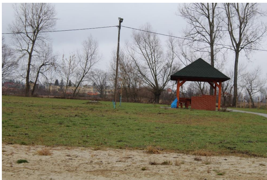
Rys. 3.4. Proponowane miejsce do odpoczynku w miejscowości Wiślica

Kolejnym proponowanym miejscem do odpoczynku może być teren w Wiślicy po lewej stronie (25,50km) gdzie znajduje się wystarczająco dużo miejsca na lokalizację pola biwakowego lub campingowego. Na powyżej opisywanym obszarze znajduje się drewniana altana oraz ławki (Rys.3.4.) a kilkadziesiąt metrów dalej - stadion sportowy w Wiślicy.