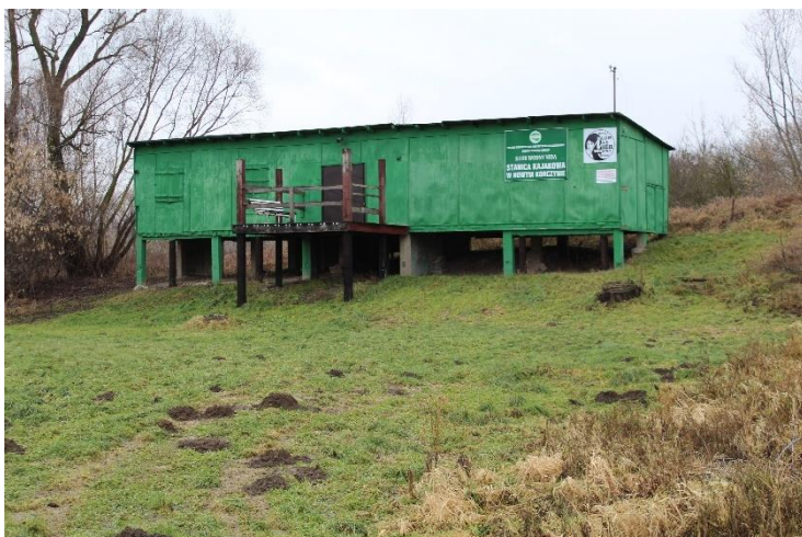
Rys. 3.5. Stanica Wodna PTTK Busko

Przed mostem w Nowym Korczynie znajduje się Stanica Wodna PTTK Busko z dogodnym miejscem do przybicia do brzegu oraz trasą dojazdową aż do brzegu rzeki (Rys. 3.5.)