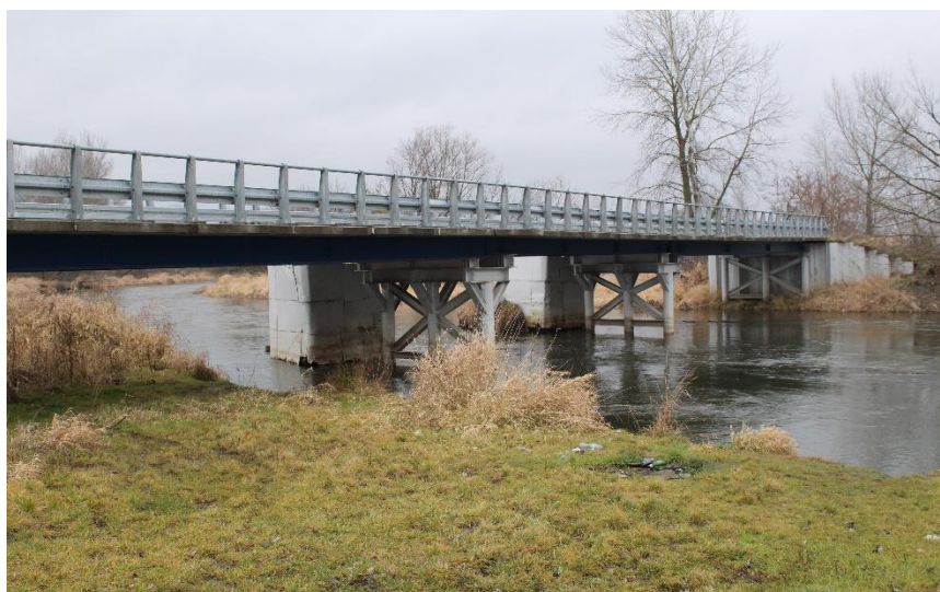
Rys. 3.3. Proponowana lokalizacja punktu startowego we wsi Czarkowy