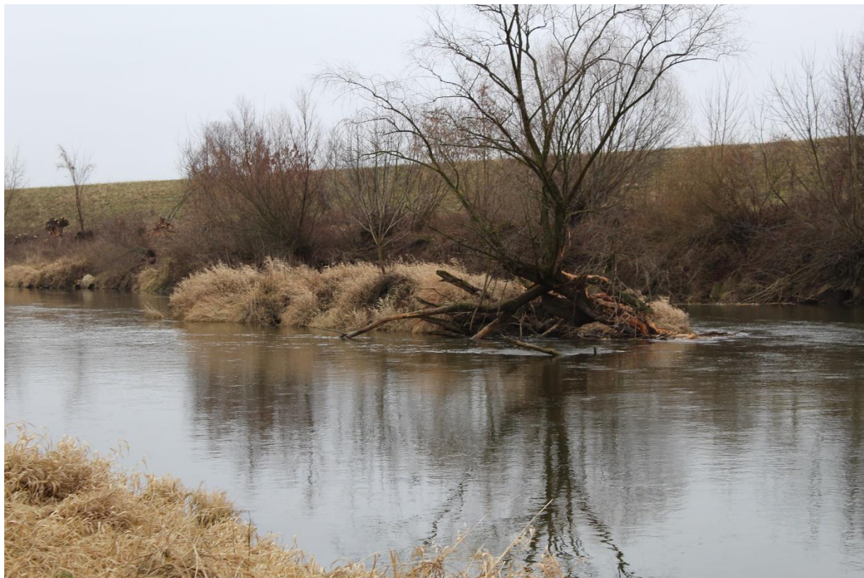
Rys. 3.2. Powalone konary drzew I

Szlak łatwy i bardzo malowniczy, a jednocześnie zaciszny, ponieważ nie jest przesadnie oblegany przez turystów odcinkiem. Na trasie czeka kilka nieuciążliwych utrudnień jak wystające pale czy wysepki do opłynięcia (Rys. 3.1 i Rys.3.2.)