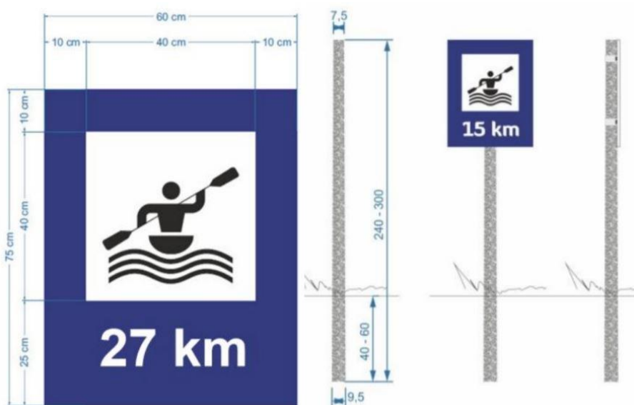
Rys. 6.2. Wymiary znaków kajakowych informacyjnych oraz słupków podtrzymujących